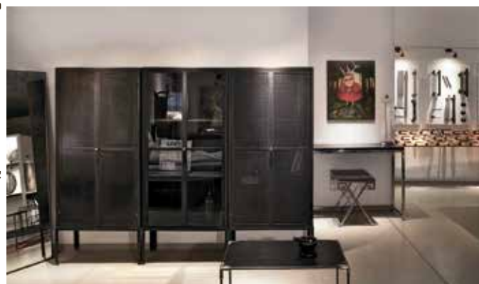
ארונות ברזל

על הפרק /// בימים אלו עובדים בגלריה על מגוון פריטים המיועדים לחדרים לדוגמה במלונות בוטיק. בנוסף שוקדים בגלריה על ייצור פריטים למבואות הכניסה בבניינים לשימור במרכז תל אביב.