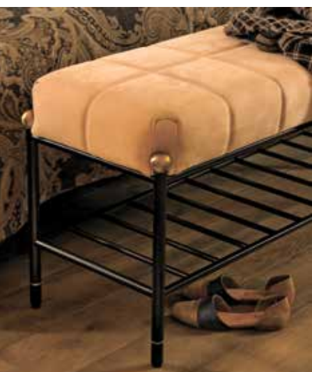
עיצוב אישי עבור האדריכל אופיר אסיאס