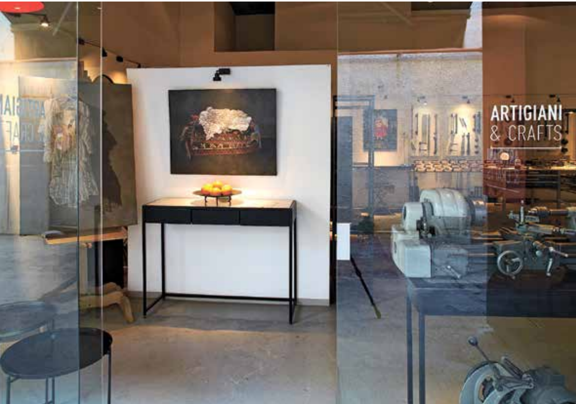
כניסה לגלריה